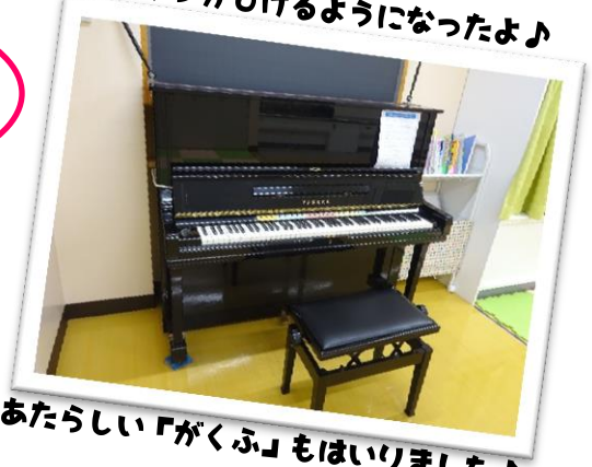
あたらしい「がくふ」もはいました♪