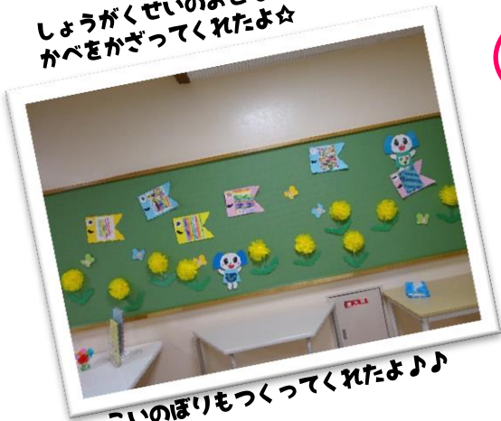
こいのぼりもつくってくれたよ♪